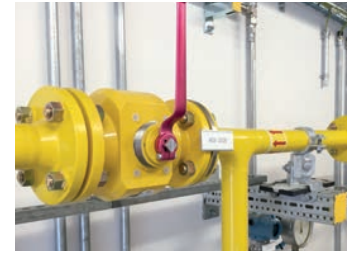
Zuverlässige Absperrung: Hartmann Kugelhähne mit Antrieb (oben) oder handbetrieben (unten)