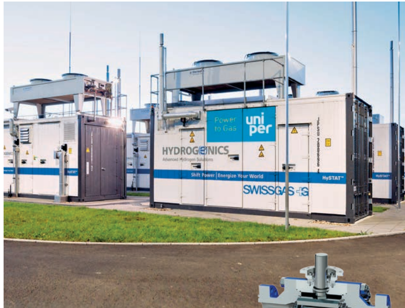
Referenzprojekt für innovatives Energiekonzept: Power to Gas-Anlage „WindGas Falkenhagen“ in Brandenburg