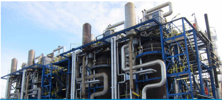
Die vier Reaktoren der POX-Vergasungsanlage bei Yara Brunsbüttel

„Hartmann eilt der Ruf voraus, der Mercedes unter den Armaturenherstellern zu sein. Wir entschieden uns bei diesem wichtigen Umbau für eine hochwertige Lösung!“